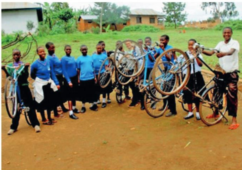
Stolz präsentieren die Schülerinnen und Schüler der Nyakitaba Sekundarschule ihre Drahtesel.

Der Tag der Schülerinnen und Schüler an der Nyakitaba Sekundarschule beginnt früh. Um acht Uhr startet der Unterricht. Aber vorher wird das Schulgelände geputzt. Die Jugendlichen kommen von weit her, denn weiterführende Schulen sind in ländlichen Regionen wie Nshamba rar gesät.