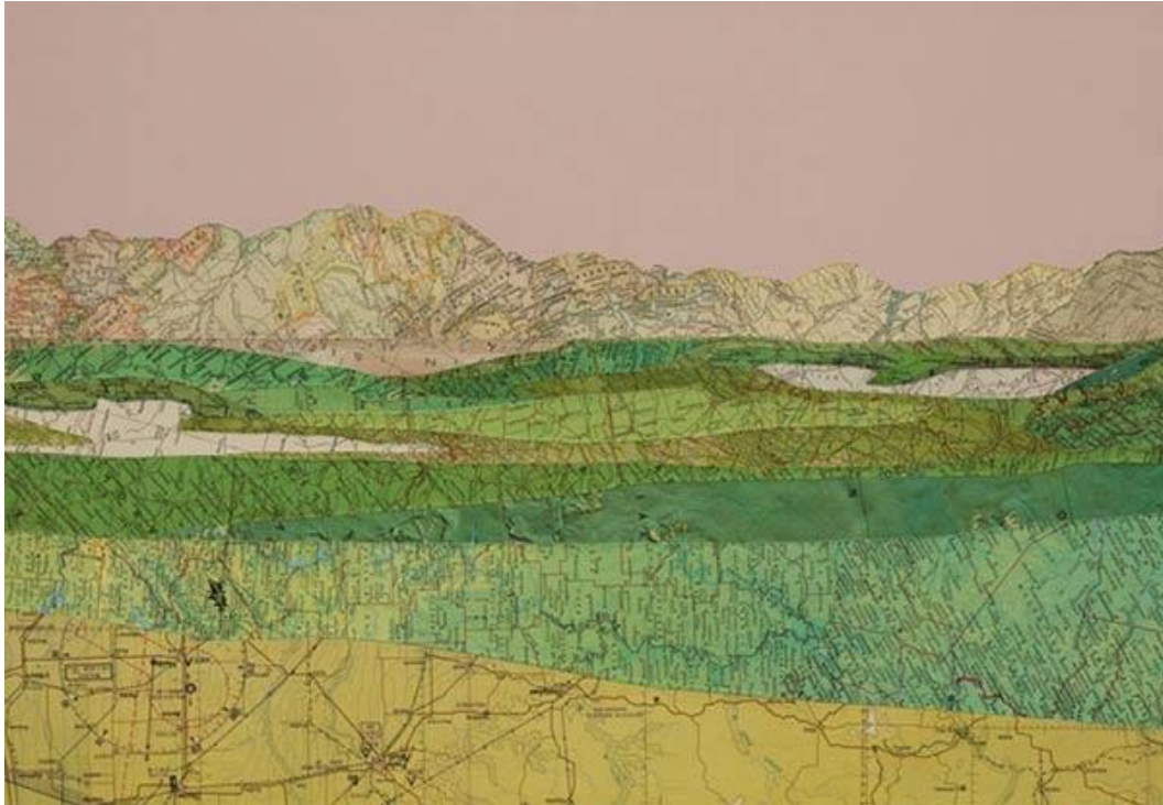
Empire revisited (eingelegte Karten, Acryl, auf Tafel) von Matthew Cusick / Künstler, gestaltet Gemälde mit alten Landkarten oder verändert alte Schulbücher, indem er mit Sandpapier die Texte bis auf einzelne Bilder und Worte entfernt.