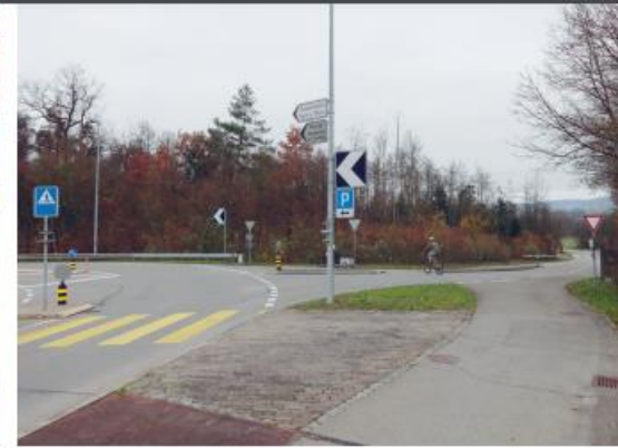
Hauptstrasse Frauenfeld–Warth mit Abzweiger Richtung Kaserne Auenfeld, Auto hat Vortritt, wenn es den Radweg quert, Velo fahrende sehen rechts abbiegende Autos schlecht und zu spät.

Bei Radwegen sind neben Anfang und Ende die Einmündungen von Nebenstrassen grosse Knackpunkte. Soll das Auto oder das Velo Vortritt haben? Beide Varianten haben punkto Unfallgefahr und Komfort Vor- und Nachteile.